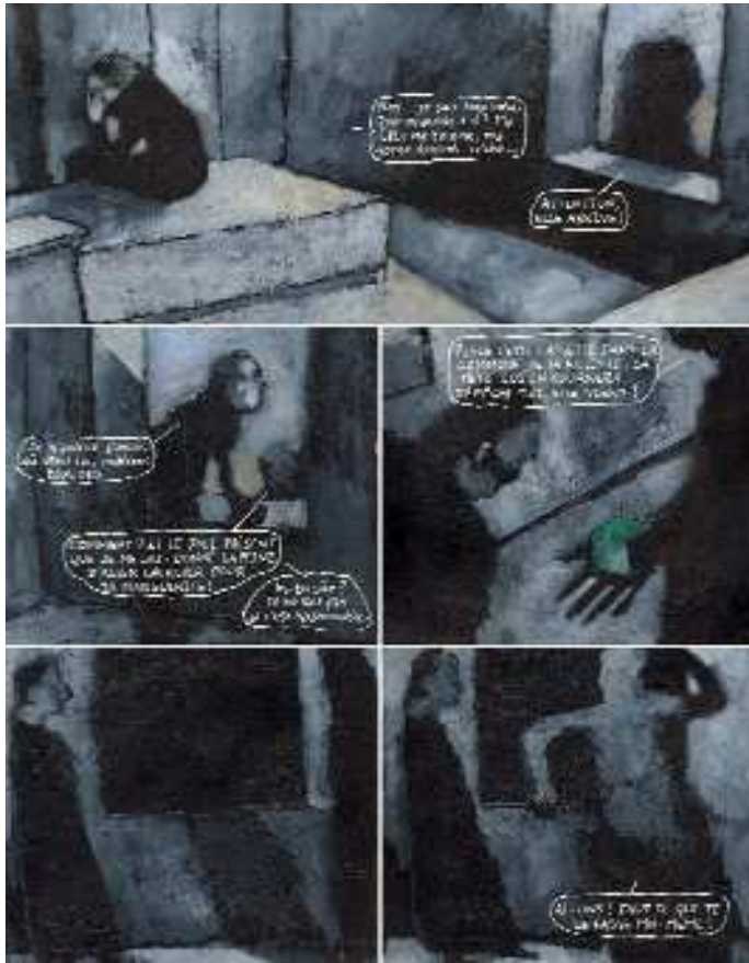
Faust page 36