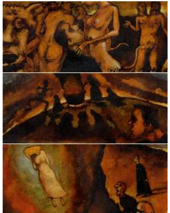
Faust page 63

La couverture offre un mélange d'encres, de brou de noix (pour sa couleur brune unique) et de peinture acrylique.