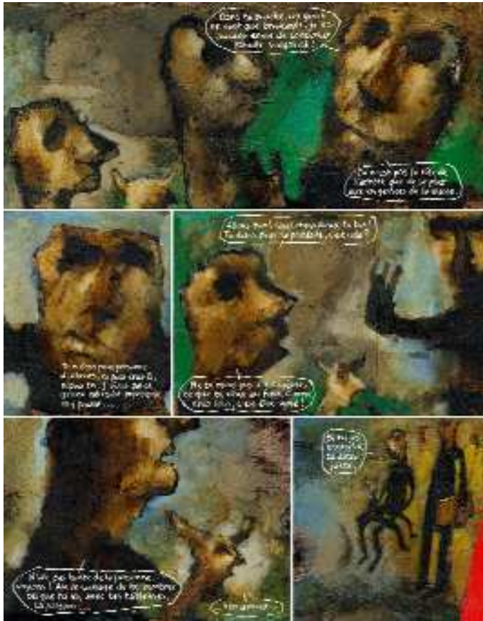
Faust page 7