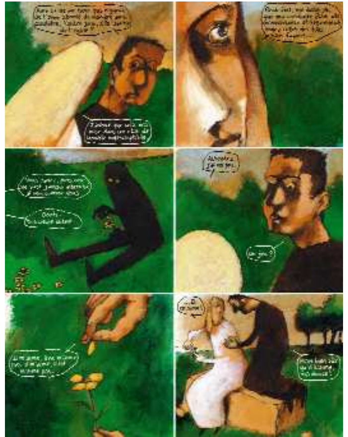
Faust page 41

Publié dans un grand format souple à rabats (24x30 cm) et imprimé sur un luxueux papier offset (non-glacé) permettant un rendu plus chaleureux et plus proche de l'original que les habituels papiers couchés, cette édition en bande dessinée de Faust est complétée par un postface de 8 pages traçant un historique du mythe Faustien depuis sa création.