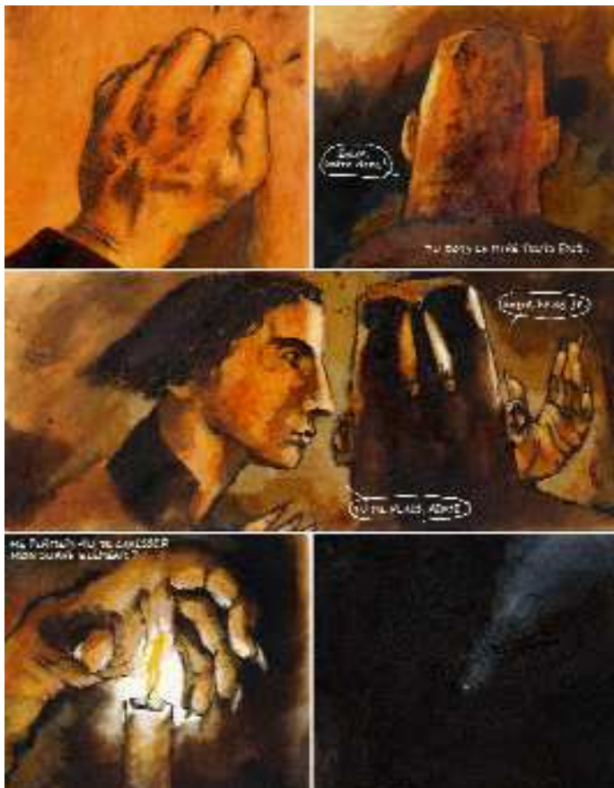
Faust page 20