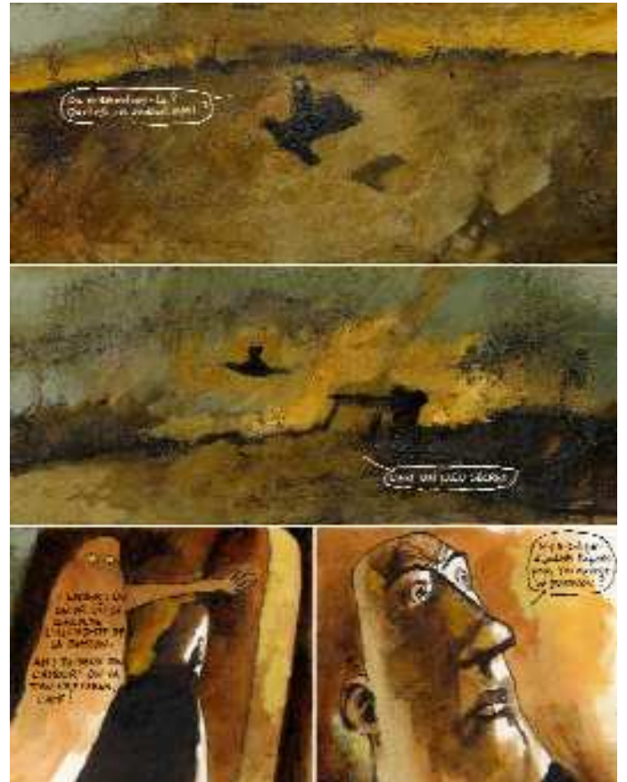
Faust page 28