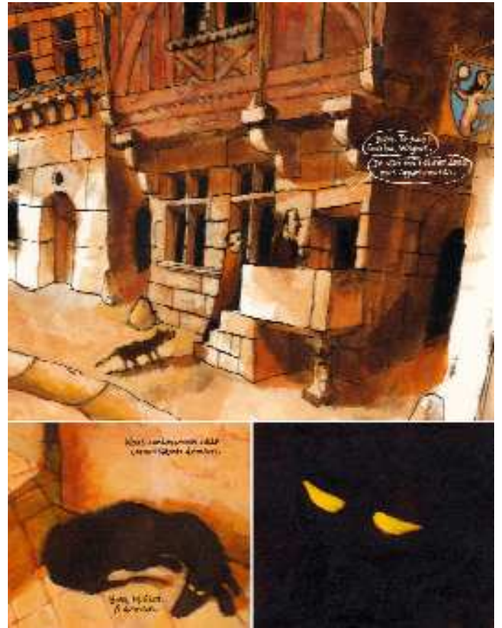
Faust page 14